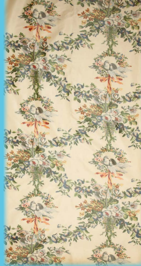
Les Perdrix, dessin de Philippe de Lasalle, imprimé par Tassinari-Châtel, 1771 Taffetas de soie imprimé sur chaîne à la planche

À partir du milieu du XIX e siècle, des couturiers, tels Charles Frederick Worth et Jacques Doucet, gagnent en influence par leur style. La structuration de la Haute-Couture s'accroît au début du XX e siècle et se poursuit avec l'émergence de grandes maisons de couture (Callot Sœurs, Paquin, Paul Poiret, etc.). De nos jours, avec l'essor de l'uni, les productions imprimées au cadre sont destinées essentiellement au marché du luxe, bien que cette industrie recourt de plus en plus aux impressions rotatives et numériques à jet d'encre utilisées également pour le prêt-à-porter.