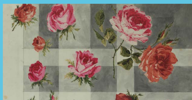
Empreinte, Ets Brunet-Lecomte, Bourgoin XX e siècle

• Des motifs à thème : animalier, aquatique, figuré, monde enfantin, floral, etc.