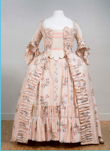
Robe à la française, vers 1770 taffetas de soie imprimé sur chaîne

À partir du milieu du XIX e siècle, des couturiers, tels Charles Frederick Worth et Jacques Doucet, gagnent en influence par leur style. La structuration de la Haute-Couture s'accroît au début du XX e siècle et se poursuit avec l'émergence de grandes maisons de couture (Callot Sœurs, Paquin, Paul Poiret, etc.). De nos jours, avec l'essor de l'uni, les productions imprimées au cadre sont destinées essentiellement au marché du luxe, bien que cette industrie recourt de plus en plus aux impressions rotatives et numériques à jet d'encre utilisées également pour le prêt-à-porter.