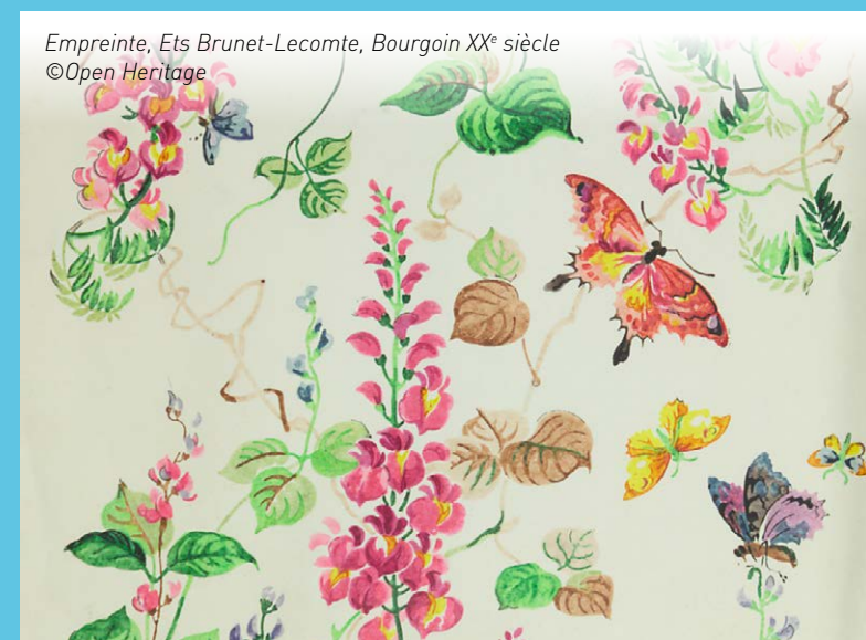
Empreinte, Ets Brunet-Lecomte, Bourgoin XX e siècle

• Des motifs à thème : animalier, aquatique, figuré, monde enfantin, floral, etc.