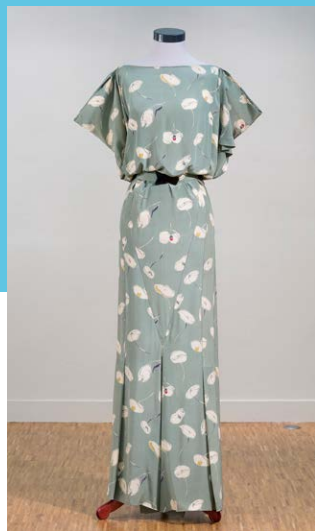
Robe de garden party Madeleine Vionnet (1876-1975) 1934