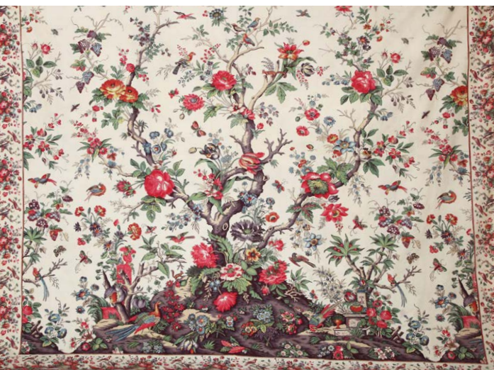
Mezzaro del Castagno Voile utilisé par les femmes génoises au XIX e siècle Coton imprimé à la planche

C'est sur la forme originale du motif et les coloris que se joue le succès des ventes. Il doit s'adapter aux exigences et tendances du moment pour attirer, renouveler et conserver sans cesse la clientèle. Ils peuvent être répartis sur l'ensemble de la surface imprimée (all over) ou être placés. Plusieurs grandes catégories peuvent être distinguées :