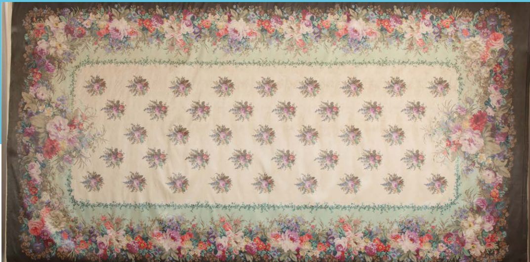
Nappe de la Reine des belges Imprimé par les Ets Brunet-Lecomte, Bourgoin Soie imprimée sur chaîne à la planche ©Cailloux et Cie, Pascal Lemaître