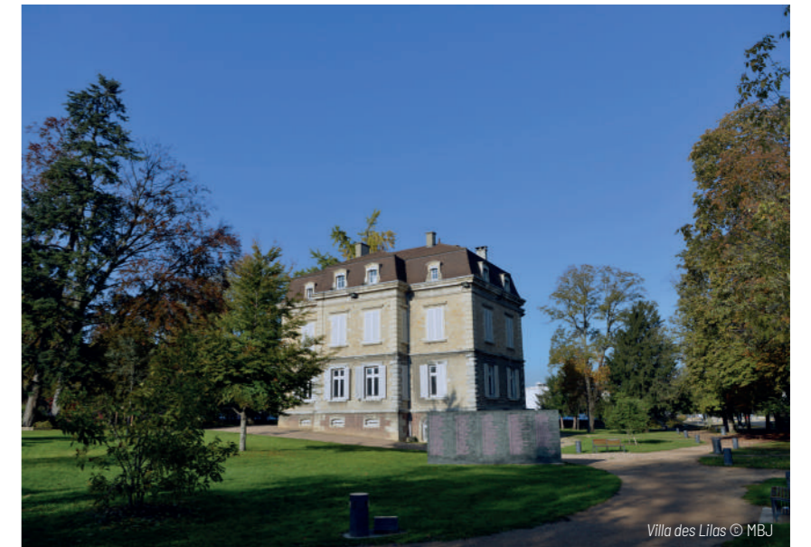
Villa des Lilas

Départ du musée / Arrivée à la villa des Lilas, siège actuel du CROS Rhône-Alpes (16 boulevard Jean-Jacques Rousseau)