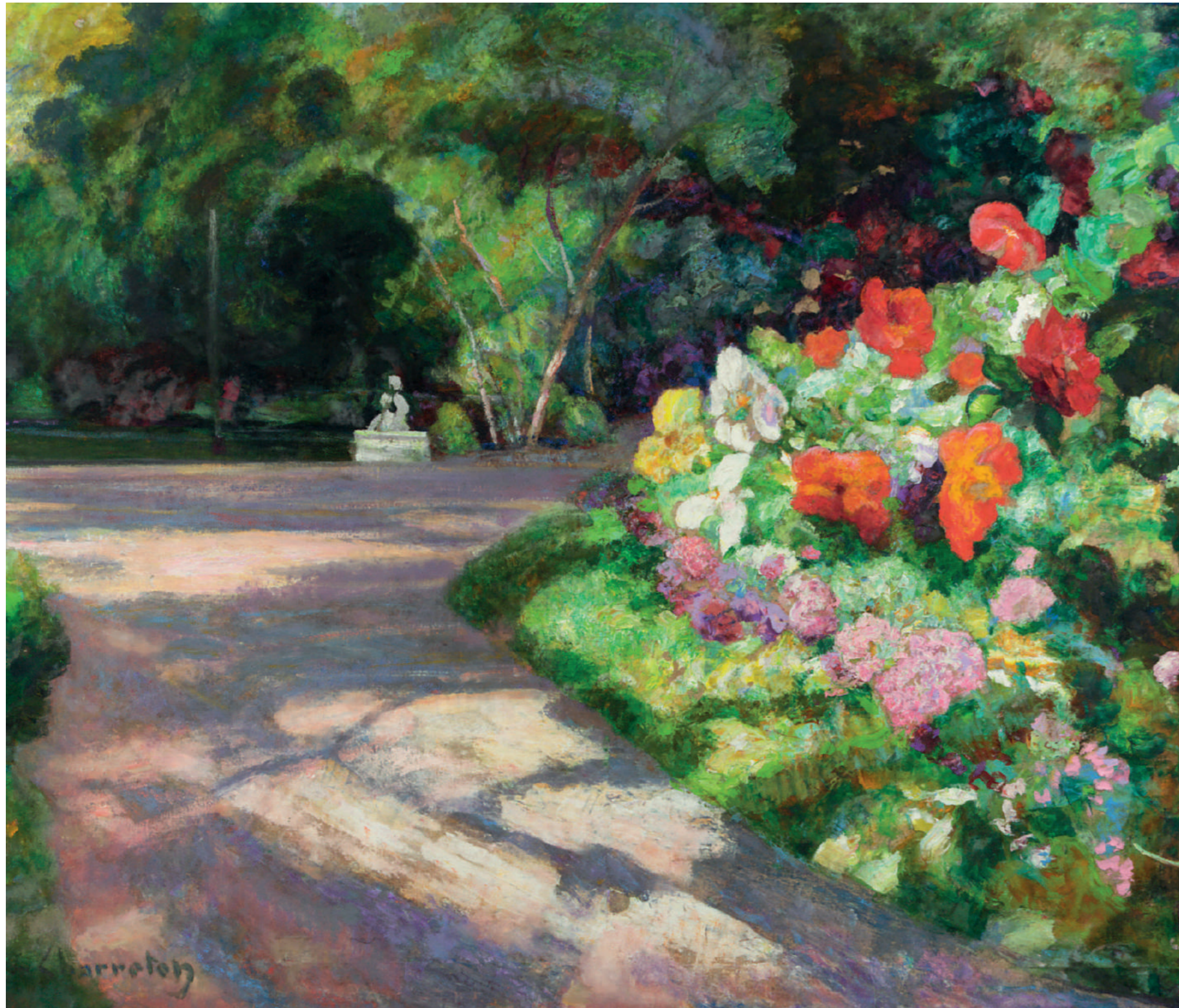
Fleurs du parc - Victor Charreton