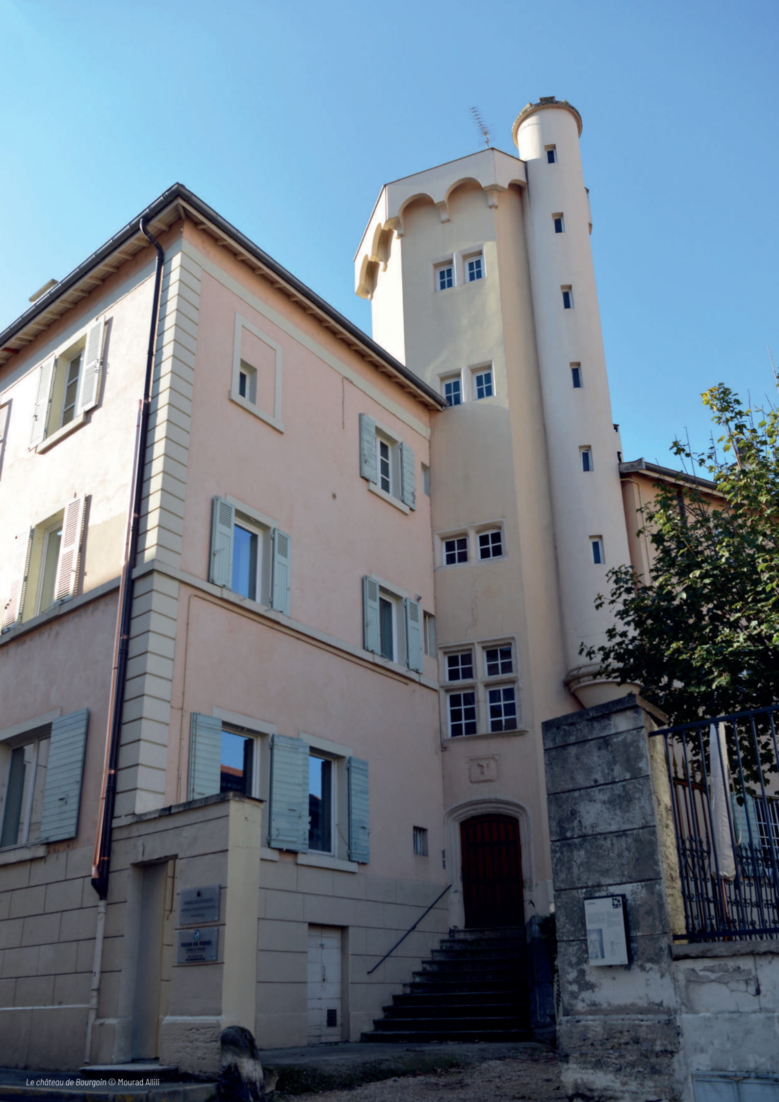
Le château de Bourgoin