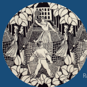
La Partie de tennis, Raoul Dufy, coll. MBJ

Le musée vous propose de découvrir un objet ou une œuvre de ses collections, suivi d'une collation et d'un café sur inscription auprès des Amis du Musée, notre partenaire.