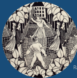
La Partie de tennis, Raoul Dufy, coll. MBJ

Le musée vous propose de découvrir un objet ou une œuvre de ses collections, suivi d'une collation et d'un café sur inscription auprès des Amis du Musée, notre partenaire.