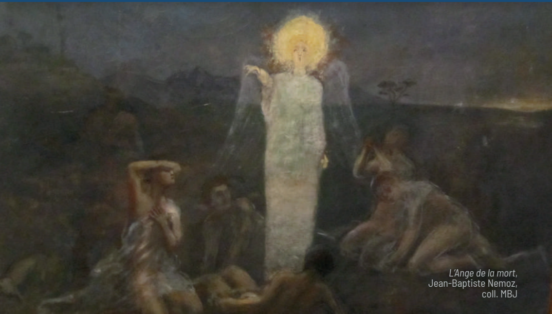
L'Ange de la mort, Jean-Baptiste Nemoz, coll. MBJ

Le Musée de Bourgoin-Jallieu et les Amis du musée et du patrimoine vous invitent à plonger au cœur de la création textile avec Les héros de l'étoffe , une série de trois films didactiques inédits. À travers ces capsules de 6 minutes, découvrez l'univers des ateliers de tissage et suivez chaque protagoniste du processus de création d'un tissu, des premiers motifs jusqu'à la trame finale. Entièrement réalisés à partir des collections du musée, ces films mettent en lumière les savoir-faire, les gestes et les techniques qui ont façonné l'excellence textile de notre territoire. Une immersion captivante au cœur d'un patrimoine vivant !